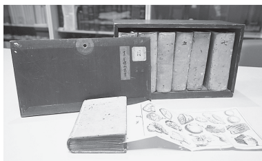
図2. ラーナウ『諸術秘蔵』

です。江戸時代にはヨーロッパや中国でも入手困難とされていましたが、1764 (明和元) 年に博物学者の平賀源内と中川淳庵が秩父山中での発見により火浣布の作成に成功しています。