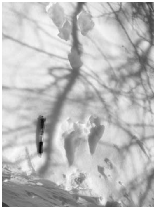
図5. ニホンノウサギの足跡 (2010年2月撮影)

雪上でニホンノウサギの次に頻繁に足跡が観察されたのは、ホンドテン、タヌキおよびアカギツネといった中型の食肉目であった。3種すべてが雑食性であり、果実、昆虫、小型哺乳類、鳥類など、季節に応じて餌生物を変化させる生態をもっている。このような様々な餌生物を必要とし、食物連鎖の頂点に位置する哺乳類が多く生息しているということは、その餌生物の多様性を反映しているものと思われる。