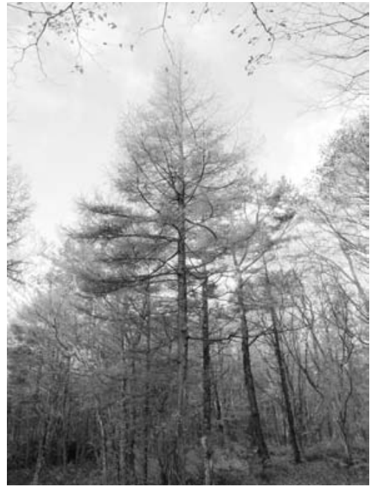
図3. 南斜面の風景(2010年11月撮影)

交互に密生し、ササの粗な部分ではスゲ類やコバノフユイチゴが優占して生育していた。散策路は羽鳥湖を見下ろす展望台に続く尾根線になっており、明るい林床にはマイヅルソウの密生も見られた。南斜面はカラマツの優占する舗装道路脇からヤマグワ、アオダモ類などが混じり、南から南西に散策路を進むとカエデ類も頻繁に見られた(図3)。また、東斜面へと続く道にはアカマツも点在した。林床にはスゲ類が一面に優占し、サカゲイノデといった大型のシダ類が目立った。散策路の縁にはクマイチゴ、