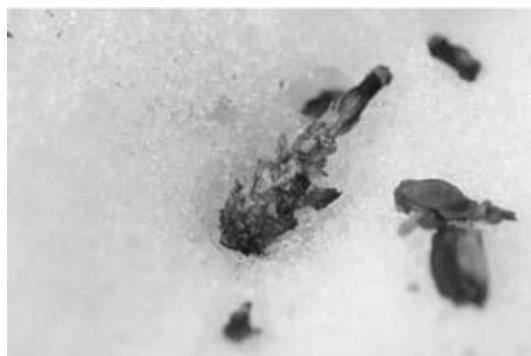
図6. ニホンリスがアカマツの球果を食べた跡(2009年2月撮影)

また、今回の調査では福島県のレッドリスト(福島県生活環境部環境政策課、2003)に記載されている2種の哺乳類を確認することもできた。ツキノワグマとニホンモモンガである。ツキノワグマは冬季に足跡(図7)を、ニホンモモンガは冬季に糞を確認した。ツキノワグマは植物に偏りがちな雑食の性質を