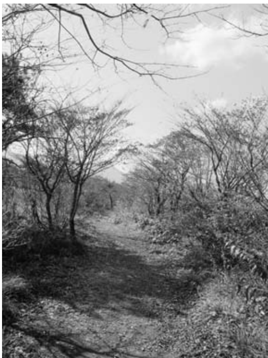
図4. 北斜面の風景(2010年11月撮影)

イヌツゲといった低木を主に見る事ができた。北斜面は背の低い樹木によって構成されており、特にハンノキ類が多かった(図4)。散策路の北側林床