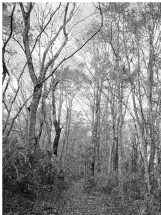
図2. 東斜面の風景(2010年11月撮影)

東斜面の森林には若いブナとミズナラを中心とし、リョウブやカエデ類が点在していた(図2)。林床には局所的にササ2種が