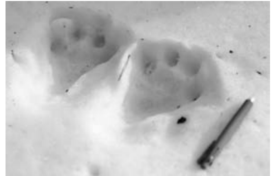
図7. ツキノワグマの足跡 (2009年2月撮影)

よる狩猟によって、本種は全国的に生息域をせばめ、絶滅が危惧されている種である。ニホンモモンガは樹洞を巣にすることが多く、山地に生息する日本固有種である。やはり夜行性で確認が困難であり、福島県のレッドリストでは未評価区分として記載されている。