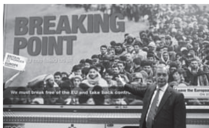
図2 ファラージ党首(当時)によるポスター