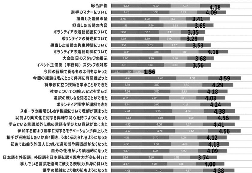
グラフー1. 平昌五輪ボランティアに参加後の自己評価（神田外語大学生 67名）

活動の内容は、インフォメーションセンターや紛失物センターでの対応、観客案内、誘導、出入統制、関係者入口対応等広範囲にわたる活動であった。