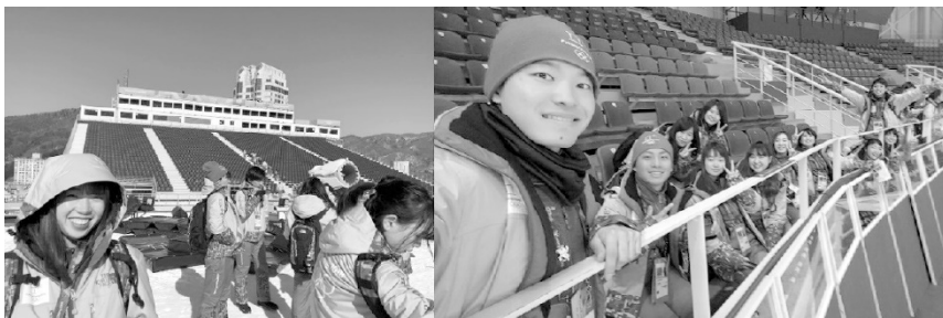
写真－1. 平昌冬季五輪大会のボランティア活動

2016年6月に、全国外大連合は通訳ボランティアを通じた連携を目的に、平昌五輪大会組織委員会と韓国ソウルにて協定を締結し、2018年2月には、全国外大連合