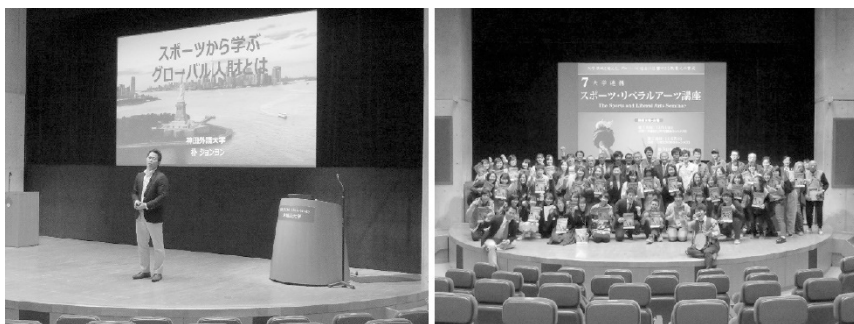
写真-2. 7大学連携スポーツ・リベラルアーツ講座

講座に参加した神田外語大学の4年生は「神田外語大学は文系なので、人間工学やAI等理系分野の講義が新鮮でした。スポーツをいろいろな視点から学ぶことが大事だと実感できた」と言い、文系や理系にとらわれる視点から学問の分野を融合し、学びの楽しさを気づかせ、参加者一人一人の興味・関心を引き出すための教育として考えていくことが大切である。毎日新聞出版（2020） 9 によると、コロナ禍で21