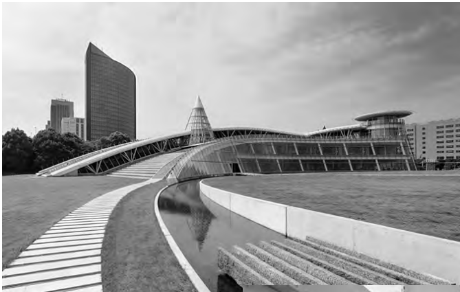
図2 7号館（図書館）外観

また、平成 20 年に現在の図書館が 7 号館の 1 階部分「学習空間としての図書館」をコンセプトとして新しく建築された。ガラス張りの明るく開放的な空間にデスクやテーブル、椅子やソファを配置した設計が施されている。蔵書数は 177,862 冊、年間貸出冊数は 24,550 冊、年間入館者数は 154,096 人となっている（いずれも平成 27 年度）。