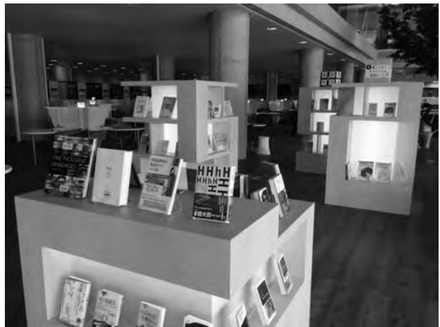
図4 企画展示エリア

企画展示はポスターを学内に掲示して広報することに加えて、前述のtwitterでも情報発信するようにしている。twitterはリアルタイムにその都度情報を伝えることができる。このように、図書館内の取り組みに終わらせず、積極的に図書館外にいる学生に伝えることでより効果が上がる結果となる。